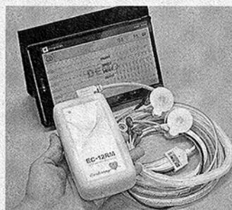
心電図伝送システム「SCUNA」の心電計(手前)と伝送に使うタブレット端末